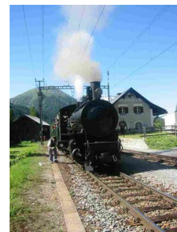
Bei Cinuos-chel Brail

Die Engadiner Dampfpost, welche den Teilnehmern auf dem Zug abgegeben wird.