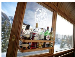
Herrliche Aussichten garantiert...