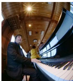
Pianist in Action...